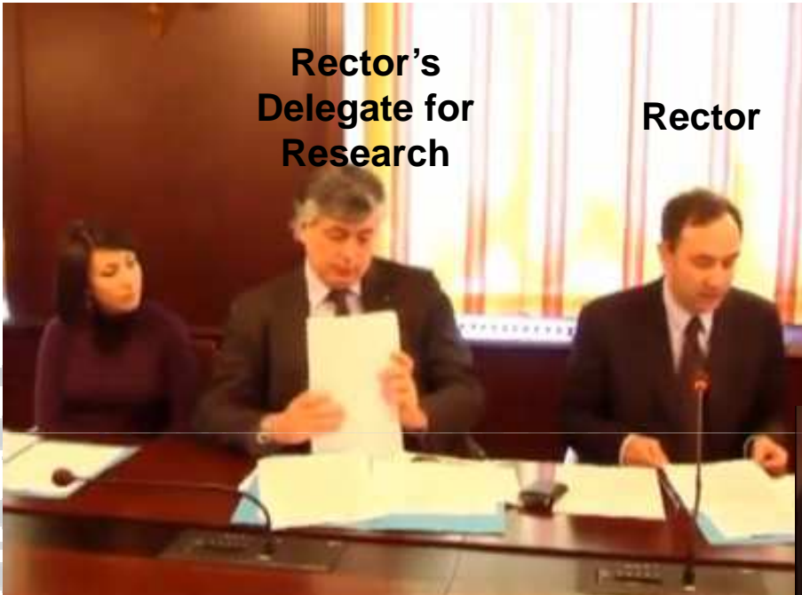
Rector's Delegate for Research