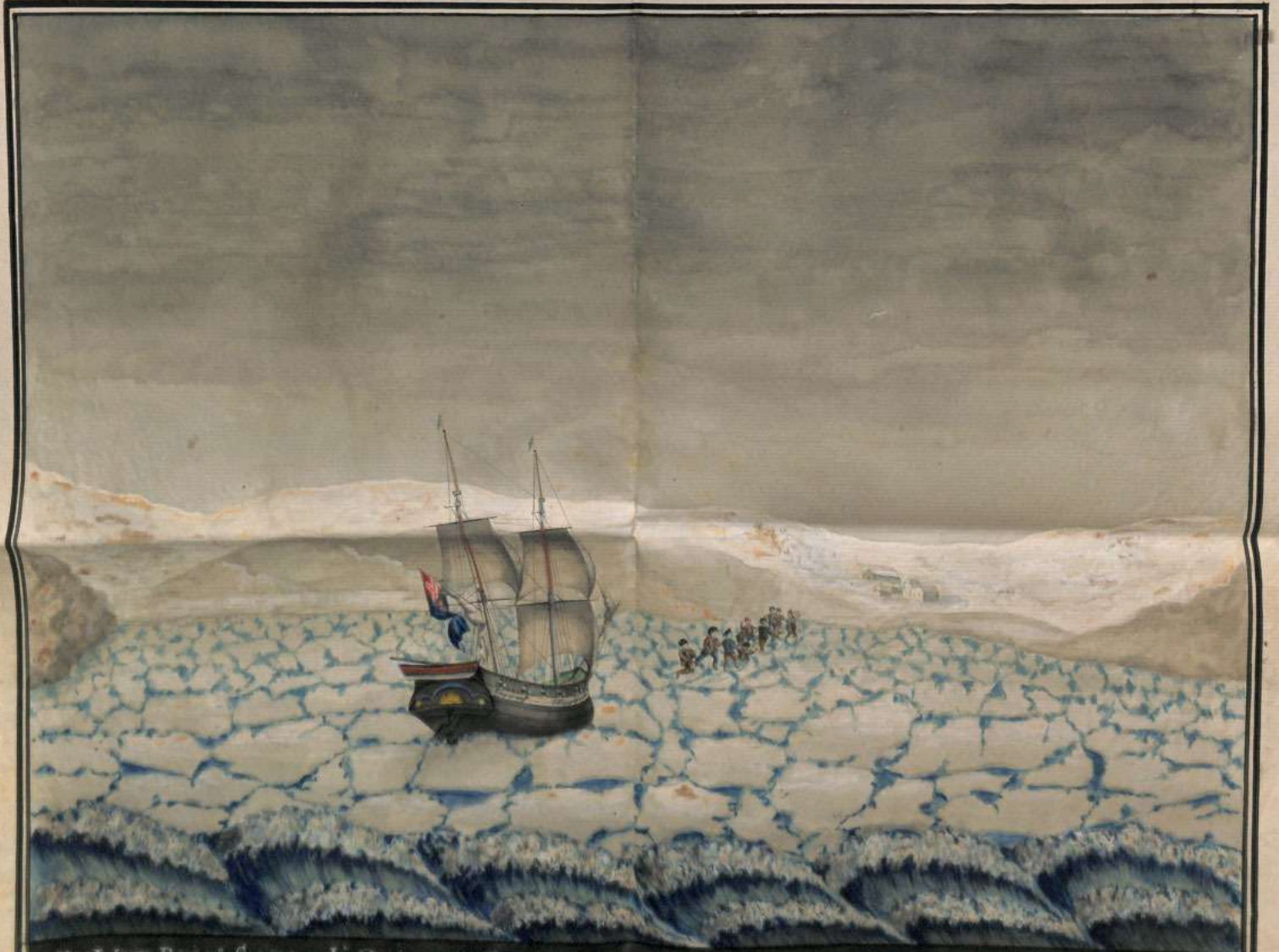
EX.VOT. BRIG. SARDO L'ORIENTE COM. DAL CAP. NIC. RIVALTA DISTACCATO DALLA RADA DI Odesa dalli Ghiacci li 19. GENARO 1829 Abbandonato nelle rive di Balaban li 24. d. S. S. sulle rive del Danubio