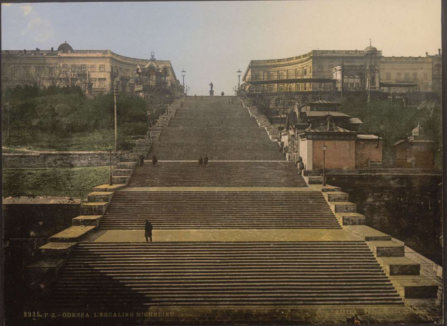
8935. P. 2. - ODESSA. L'ESCALIER RICHELIEU.

COM. - ODESSA. PUBL. - BUREAU DE LA PHOTOGRAPHIE.