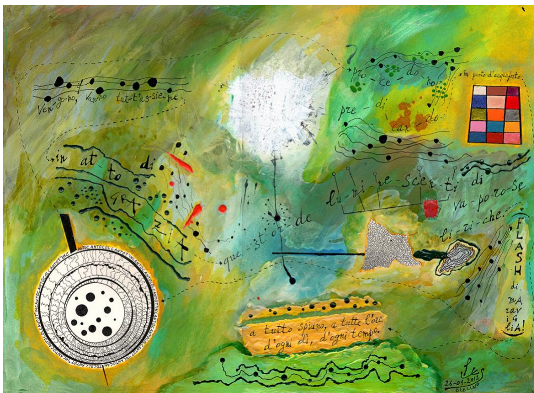
("In atto di grazia", per voce sola - China e mista su carta; cm. 37X40)