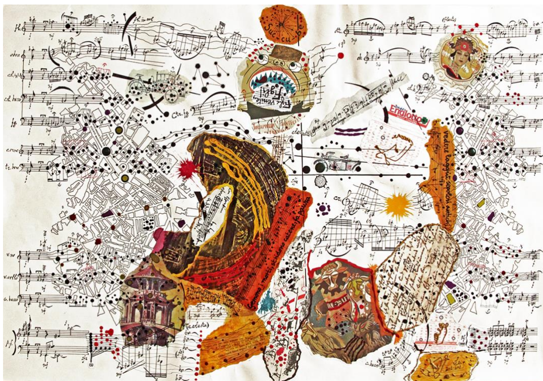
("Labirinto di Dedalo", per ensemble – China, mista e collage su carta; cm. 35X47)