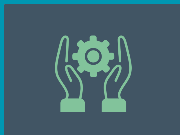
STRUMENTI E PRATICHE