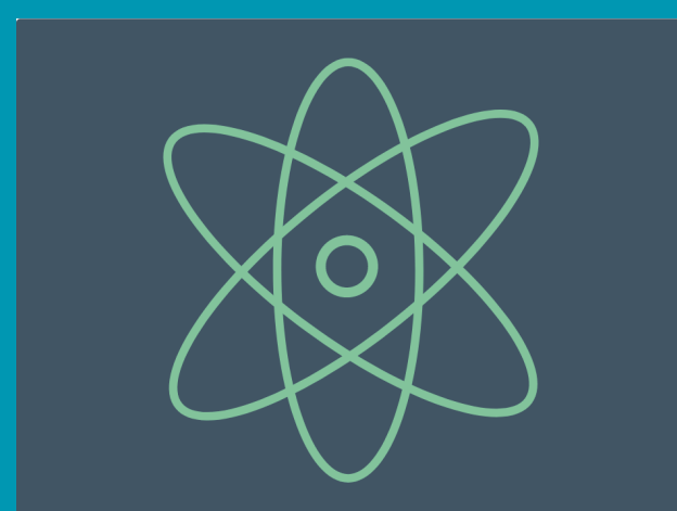
LA SCIENZA APERTA