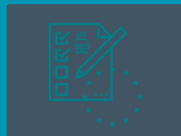
REQUISITI OPEN NEI PROGETTI EUROPEI