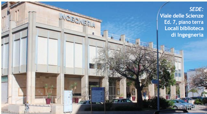
SEDE: Viale delle Scienze Ed. 7, piano terra Locali biblioteca di Ingegneria

IL POLO BIBLIOTECARIO POLITECNICO È ARTICOLATO IN 4 BIBLIOTECHE DISTRIBUITE SU 6 SEDI DI SERVIZIO.