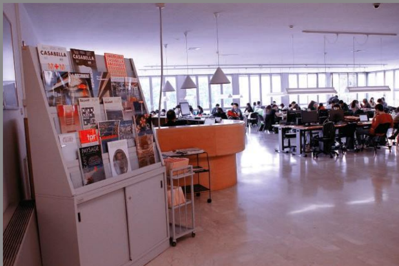
Emeroteca 3° piano