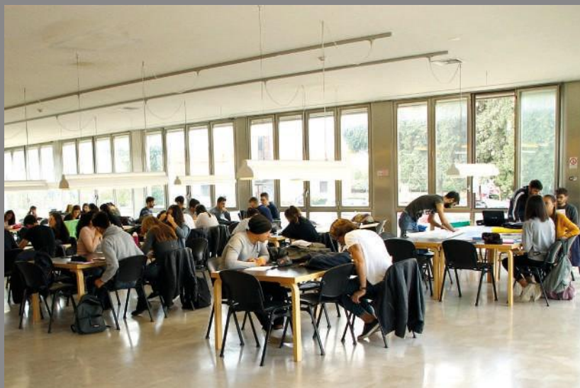
Sala lettura 2° piano