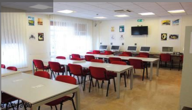
Sala Lettura Blu