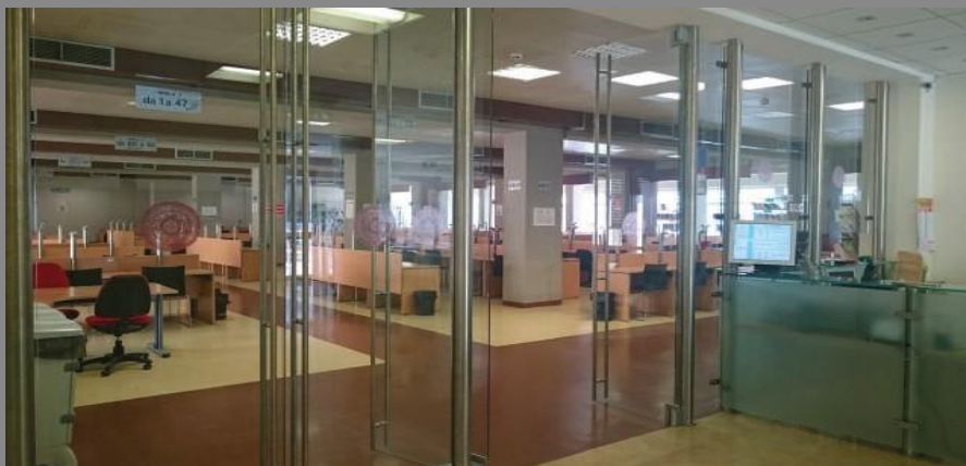
Sala Lettura Rossa