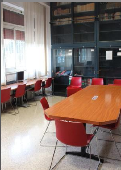
Sala Lettura C